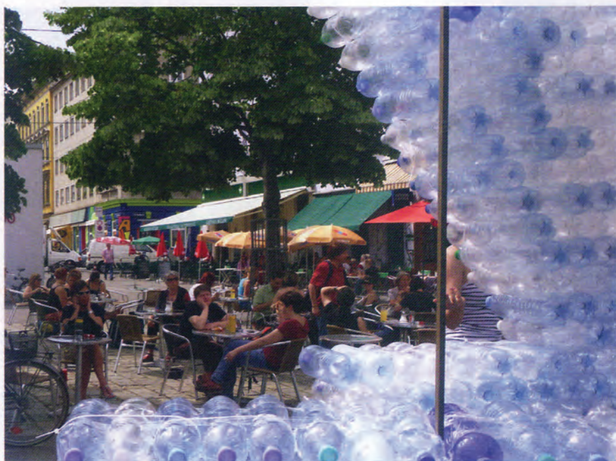
luxury blue Installation im öffentlichen Raum, SOHO in Ottakring (2012) Sichtbar und erlebbar machen des weltweit anwachsenden Plastikmülls. Zwei Wände der begehbaren Skulptur aus 3.615 recycelten PET-Flaschen bildeten einen sich verengenden Raum und machten beim Durchschreiten die Verknappung der Ressource Wasser erfahrbar.